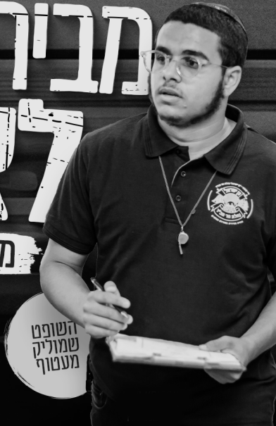
השופט שמוליך מעטוף