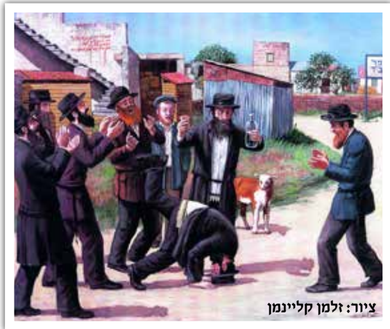
ציור: זלמן קליינמן