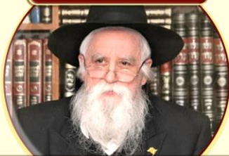
לזכות המשפיע הנודע הרב יוסף יצחק אופן שליט"א