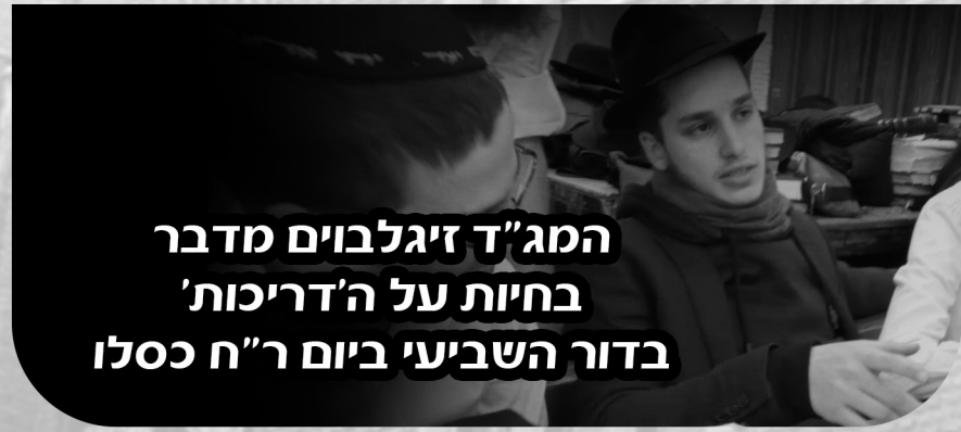
המג"ד זיגלבוים מדבר בחיות על ה'דריכות' בדור השביעי ביום ר"ח כסלו