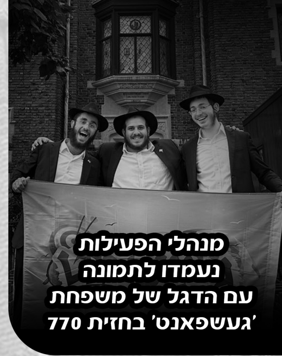
מנהלי הפעילות נעמדו לתמונה עם הדגל של משפחת געשפאנט' בחזית 770