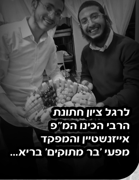
לרגל ציון חתונת הרבי הכינו המ"פ אייזנשטיין והמפקד מפעי 'בר מתוקים' בריא...