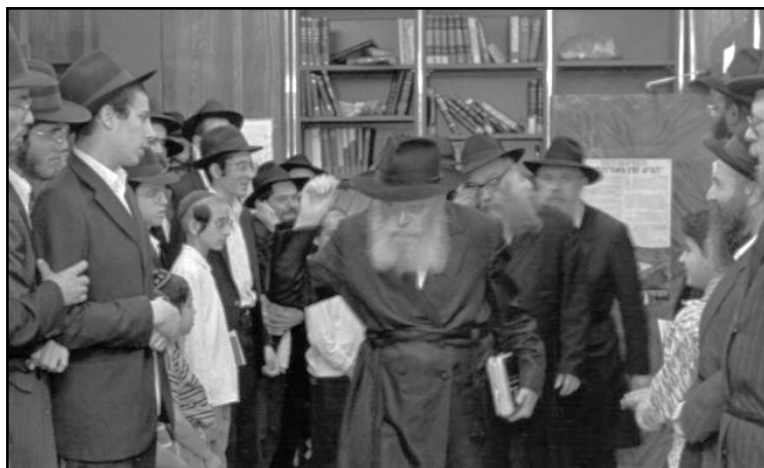
על הדלת: ציטוט הי'לקוט שמעוני' המפורסם