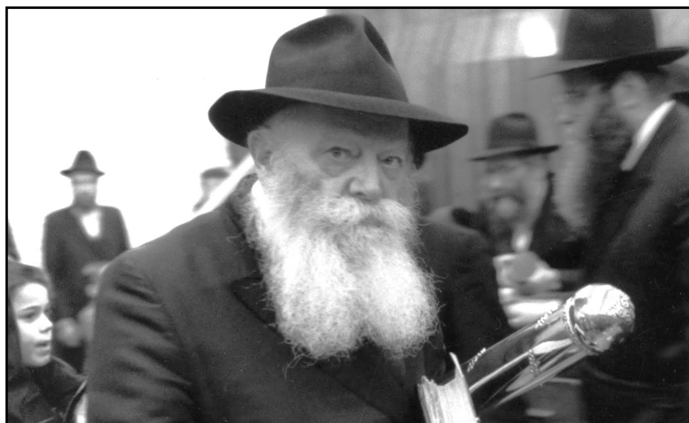
ליל פורים ה'תנש"א

לדחות חתונה וזה עושה מזל רע. מאז שהחלטנו לדחות המצב בינינו השתנה ונוצרו מתחים. הייתי רוצה שתייעץ לנו מה לעשות בקשר לחתונה וכמובן לקבל את ברכתך, אשמח לקבל תשובה. . האם לעשות את החתונה פה, זה אפשרי, או לחכות למועד אחר שהמצב בארץ ישתנה":