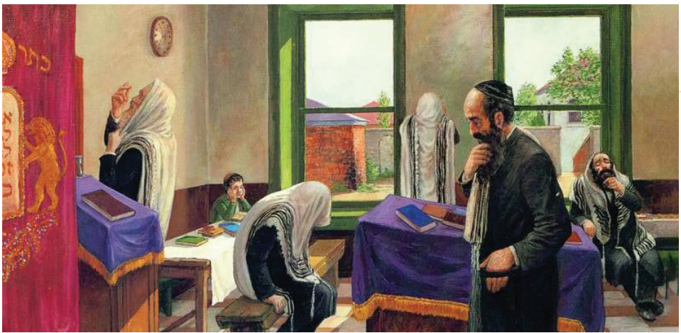
אור: דניאל קליימן