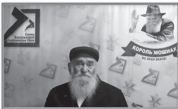
בתוכנית על 'שבע מצוות' - ניסן ה'תשע"ד

לפני המלחמה היו בעיר קשינב כשבעים בתי כנסת יהודיים. בערים: בצלי, טירספול, בנדרי, אורגייב, וסורקה לכל בתי הכנסת נשלחים צורכי החג ותשמישי קדושה, לצד התלמידים השלוחים ותלמידי הישיבה הפוקדים את בית הכנסת בתקופות החגים. מסעות רבים ערך השליח הרב זלמן אבעלסקי, הרב הראשי למדינת מולדובה ובירתה קשינב, ברחבי הערים הכפרים בהם מתגוררים יהודים, יסד ומסר שיעורי תורה לרוב, הקמת מוסדות חינוך מועדוני צבאות השם ובתי ספר לימי ראשון ועוד.