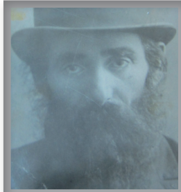
סביו הרב הראשי לברית המועצות

מספר שנים גדל והתחנך עם אחיו אצל סבו הרב שוב, ממנו למד תורה ויראת השם וראה ניסים ונפלאות שחולל.