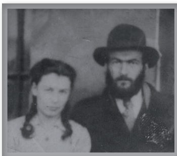
בהגיעם לארץ הקודש

בישיבה בפוקינג קיבל את הוראה מאדמו"ר מהוריי"צ לצאת לרומניה בשליחות סודית ביותר במטרה לסייע משם ביציאתם של יהודי רוסיה. שליחות זו הייתה כרוכה בסיכון רב והרבה מאד מסירות נפש, בתנאים הקשים ביותר של רוסיה הסטאליניסטית. זמן רב חיפשו אחריו, ורק בחסדי השי"ת יצא בריא ושלם מתוך לוע הארי.