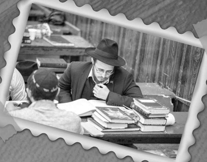
המפקד נתנאל יושב שקוע בלימוד מאחר כהכנה ל"א ניסן - יום ההולדת ה-121 של הרבי פליט"א מה"ח