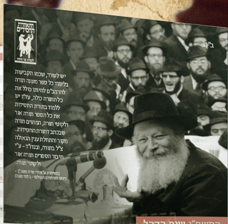
התשפ"ג שנת הקהל