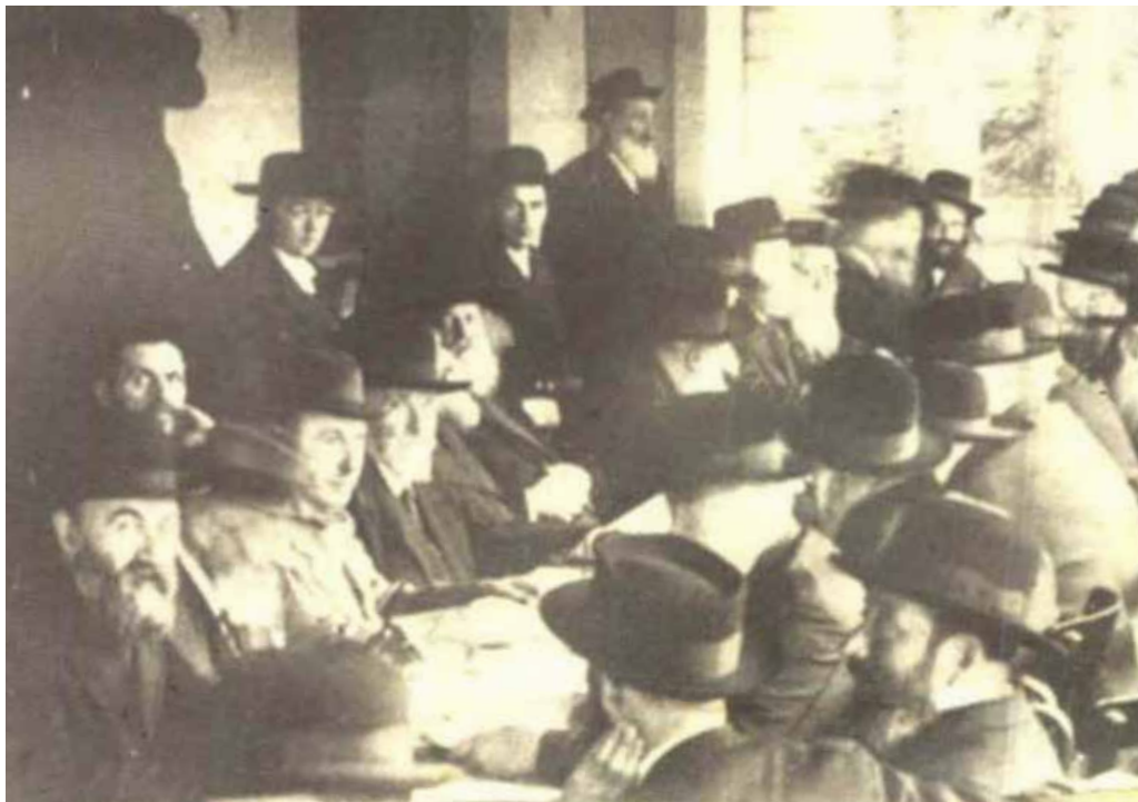
ישיבת המועצת בכנסיה הגדולה השלישית