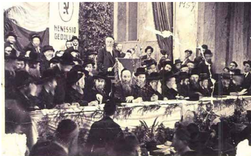
גדולי ישראל בכניסה הגדולה