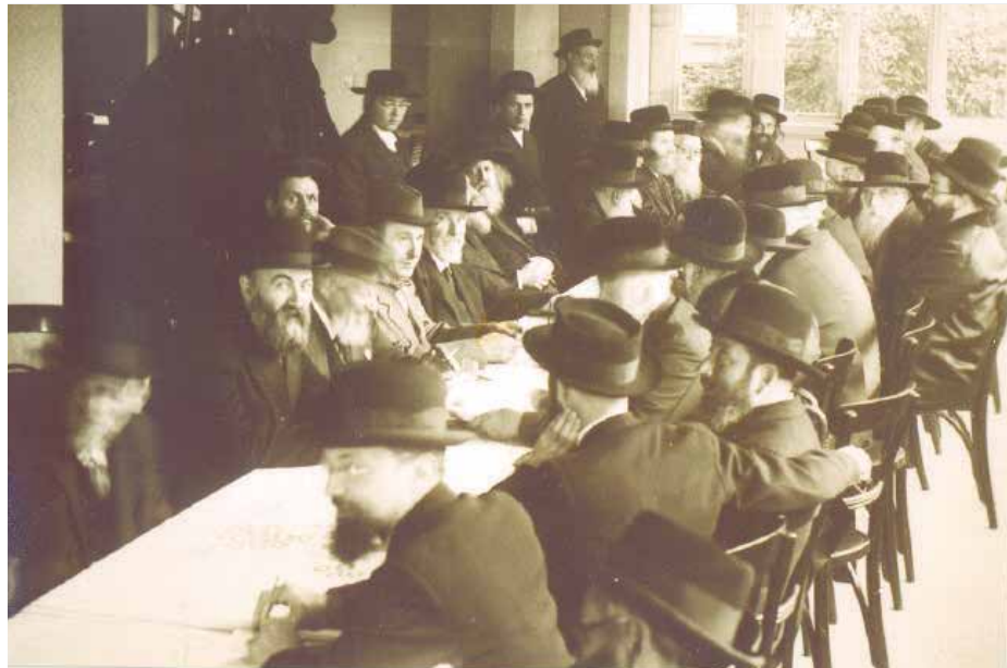
ישיבת מועצת גדולי התורה במהלך הכנסיה הגדולה השלישית - אלול תרצ"ז

הפעם הראשונה שאומות העולם שאלו את נציגי העם היהודי על גבולותיה של ארץ ישראל, היה בשנת תר”פ. כשנציגי האומות המנצחות במלחמת העולם הראשונה התכנסו בוועידת סן-רמו באיטליה, וביקשו להקים לעם ישראל את ביתו הלאומי. אמנם ה'נציגים' של העם היהודי שעמדו אז בפני נציגי האומות, לא היו כאלה שהעם היהודי בחר בהם, ורובו של העם אף לא התהדר ב'נציגים' שכאלה. אבל נציגי התנועה הציונית הם שעמדו באותו פרק מול אותם הגוים, והם התוו להם את הגבולות 'לפי מיטב זכרונם היהודי' וגבולות אלו התקבלו בהחלטת האומות.