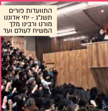
התוועדות פורים תשנ"ג - יחי אדוננו מורנו ורבינו מלך המשיח לעולם ועד