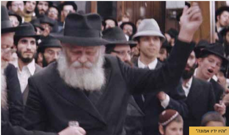
"והיו ידיו אמונה"

זה השער לכל העניינים. אצלנו חסידים יש את שולחן ערוך, מנהגים הידורים וחומרות, הנהגה דלפנים משורת הדין – ויש לנו את ההוראות של הרבי שהם 'השולחן ערוך החסידי' של איך צריך להתנהג ולפעול.