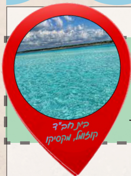
בית חב"ד קוזמא, מקסיקו