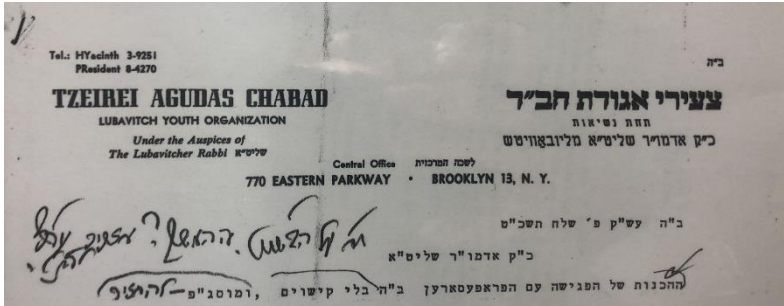
לקמן מענה רצג