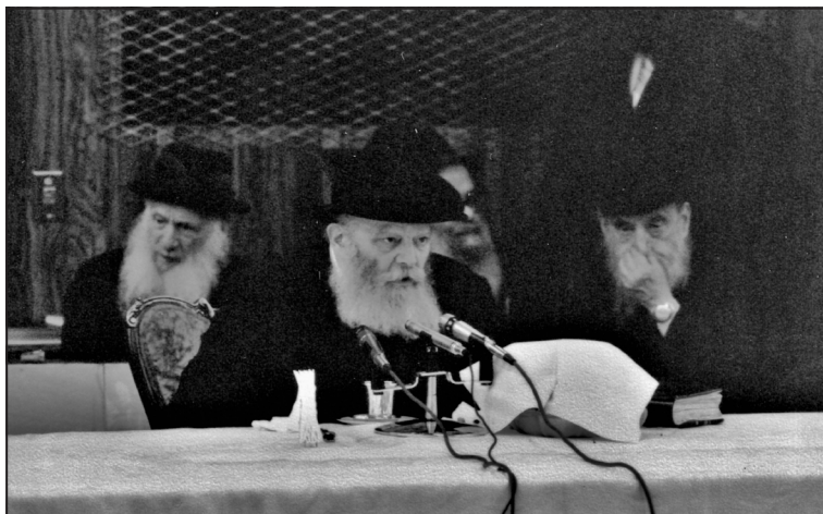
ט"ו מנחם-אב תש"מ

א. על מש"כ שלכאורה יש לשאול אותה שאלה עצמה על מה שכותב אדה"ז לפני"ז שבליילי תקופת תמוז יש ללמוד מעט, היה המענה: "(2) כי זה בא בהמשך להחתלה ו"אפילו" וכשלילה דלפני זה "ולא יאבד"