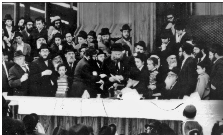
ה' סיון תשל"ה

הסדר מתחיל בשעה 7:50 היות שאנחנו יוצאים בשעה 9:20 ל770 להתפלל עם הרבי שליט"א ערבית אולם היום הרבי צם בה"ב ולכן הרבי התפלל בשעה 8:20 (ולא התפללתי עם הרבי ערבית ועשינו מנין בשעה 9:20 בחובבי תורה). הלילה הייתה התוועדות עם זרחי עד לשעה 2 והזיל דמעות בהתוועדות ובקיצור החברה נהנו ממנו.