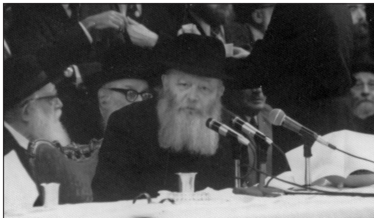
י"ג תמוז תשל"ג

הייתה הפסקה של כחצי שעה מיחידות אולם לאחר מכן בא זוג, בחור ישיבה עם כלתו, ונכנסו לרבי שליט"א שיברך אותם והיו בחדר בפנים 35 דקות, ולאחריהם בא יהודי מועמד לראש העיר והיה בחדר של הרבי שליט"א כ-35 דקות, וחיכיתי 770 עד לשעה 15 דקות לשעה 1 והרבי שליט"א יצא באותו רגע ונסע עם חודקוב.