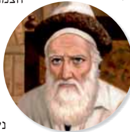
(רשימת סיפורים - מישולובין ע' 47-46)