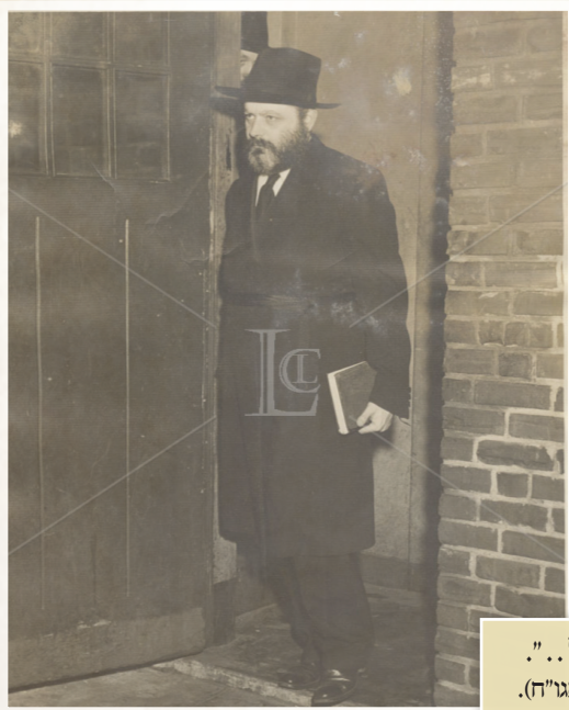
"און ליובאוויטש גייט מחיל אל חיל .." הרבי בשנת תשי"ד (ארכיון ספריית אגוד"ח).

לאורך ימים ושנים טובות לרגל יום הולדתה כ' אדר