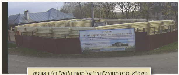
תשפ"א. מבט מחוץ לחצר על מקום ה'זאל' בליובאוויטש.