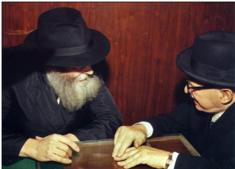
שז"ר אצל הרבי. ד' שבט תשל"ג

בפגישתו עם הרבי באותו היום, סיפר שז"ר לרבי: