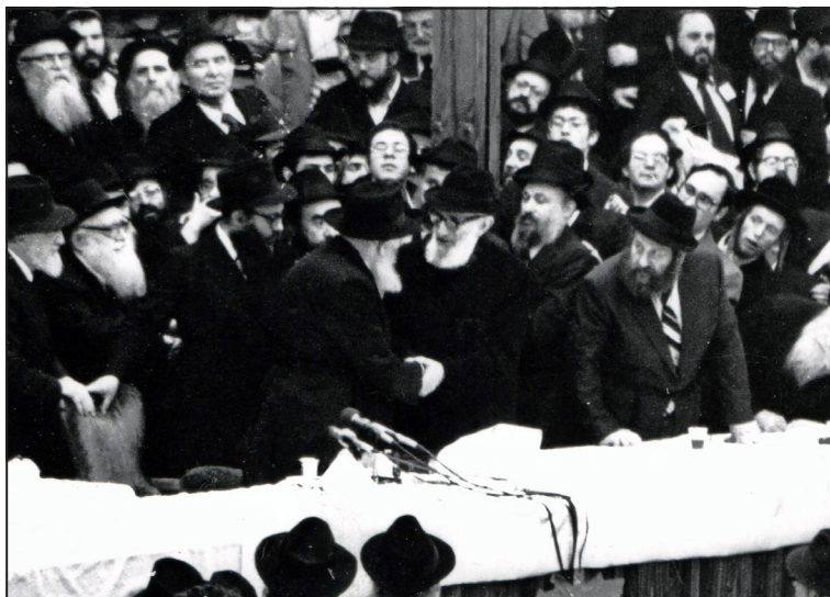
פארבריינגען יו"ד שבט תש"מ

הרב סולובייצ'יק הוא צאצא לגדולי הרבנים וראשי הישיבות בבריסק ובוואלוז'ין. הוא נמנה עם זרם ה"מתנגדים", אך כאשר התגלגלה השיחה לחב"ד, ראה צורך לספר משהו מהביוגרפיה האישית, מפרקי חוויות הילדות שלו. "לגבי חב"ד - אני נוגע בדבר" הוא אמר ופניו חייכו.