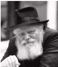
יחי אדוננו מורנו ורבינו מלך המשיח לעולם ועד