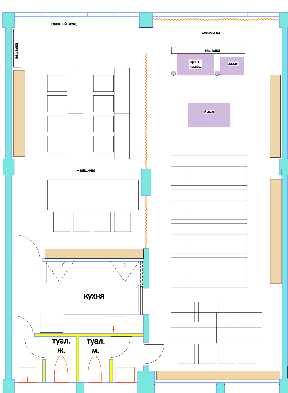
סינאגוגה "לאפיד" / основной план вар.3