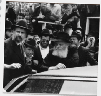
חייל חסיד שגר בארץ הקודש וטס לרבי לל"ג בעומר.