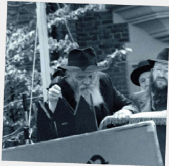
צלם: חפכ"ש-ש חפץ בעילום שמו..

נגשנו לאלו שכינהו כצלמי 'ממשיכים להלחם' לפני עשרות שנים במעמדי ה'פאראד' - תהלוכת ל"ג בעומר בהשתתפות הרבי שליט"א מלך המשיח << להלן חשיפות מיוחדות לחיילי קעמפ 'אורו של משיח' >>