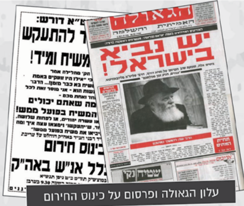
עלון הגאולה ופרסום על כינוס החירום