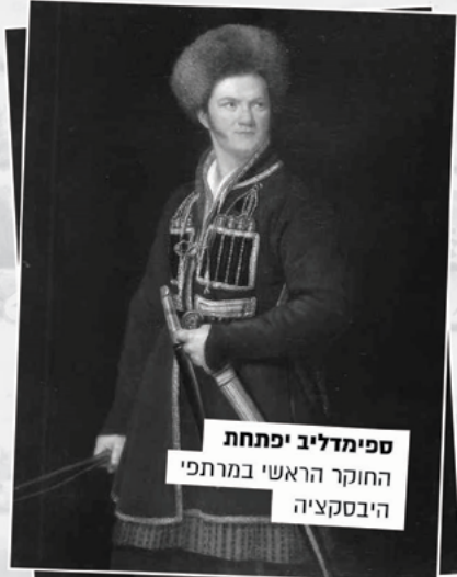
ספימדליב יכתחת החוקר הראשי במרתפי הייבסקציה