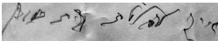
לקמון מענה קמ