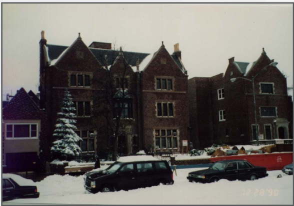
"בידיים של חסידות חב"ד" || בנין 770 בזמני החורף

מה זאת אומרת?! חסיד הוא בטל אל הרבי וזה מה שהרבי אמר! אנחנו בכלל לא מבינים בזה, אלו עניינים ששייכים לרבי שליט"א בעצמו. הרבי התבטא שהם 'משחקים בכתר' כלומר נוגעים רחמנא ליצלן בכיסא המלכות של הרבי..!