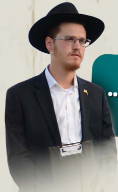
בשתי מילים.. הגנרל מוישי פרידמן

זכרו היטב, שננו השיחות האחרונות שהתקבלו, רק כך נוכל לנצח במלחמה הזו.. מוכרחים להיות חדורים בהם בדבר מלכות!..