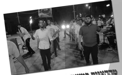
מההצבות במושתה שערך אחשוורוש