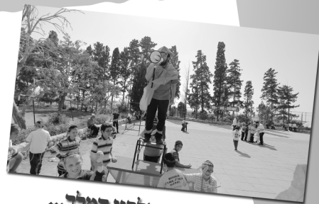
ומרדכי יצא מלפני המלך...