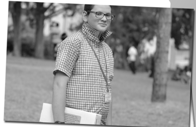
הגנרל של מרדכי היהודי