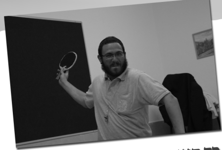
כד העיפו את המון לתליה על העץ

נמצא הבדל דק בין הגנרלים. ליפש מתחיל ב-ל, ואקסלרוד מתחיל עם כולם.