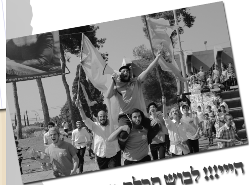
היינו לבוש תבלת מהמגילה...