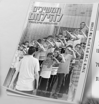
"מפקדי סירות בית חב"ד סיאול, הפתיחו את החיילים, במהדורה מרתקת של עלון 'ממשיכים להלחם' לכבוד השבת המיוחדת.

טבילה במקווה, תפילת מנחה, 'סדר ניגונים' שריגש את החיילים כמו גם את שאר הצופים. קבלת שבת סוערת במיוחד, שהרעידה את היכלות בתי הכנסת, אליה הצטרפו בהתרגשות רבה חיילים, תמימים, אברכים ומבוגרים שעוד לא זכו להשתתף בקעמפ 'אור'. סעודת שבת כיד המלך