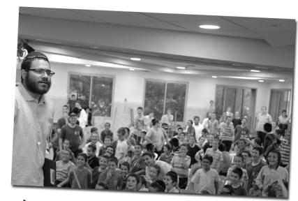
מרדכי אוסף את כל ילדי ישראל