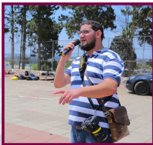
תסתדרו יפה, כינוס השלוחים ה'תשע"ח! מה לא עושים בשביל הקומיקעמפ...