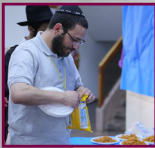
נו. מעכשיו השליחות שלי זה לאכול!