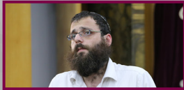
השליחות שלנו זה החדר אוכל!