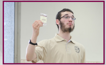
כל מי שיצא לשליחות יקבל מעטפה נדירה נדירה...