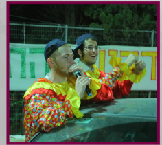
פורים שמח!!! שמעתם מגילה כבר?