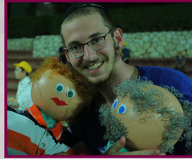
שליח כמוני חייב תמונה עם המקורבים..