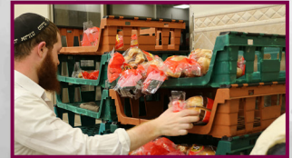
אז כאילו זה המקורבים שלנו?!