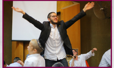
אורן: אני שליח כבר עשרות שנים! כץ: גם אני פיצה עם זיתים..