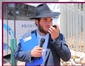
צלם לכאן זריץ, אני חייב לצלם מה שהולך פה