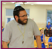
השתגעתי כולכם?! אחרון בחודש אבי! אופי! זה השליחות שלי להיות קשוח!