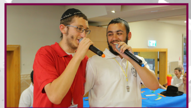
שניאור: היי, השליחות שלי זה לצעוק ברמקול חיים: חחח.. הרמקול אצלי כבר שנים!