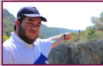
כולם! לצאת לשליח'ים. זו פקודה!