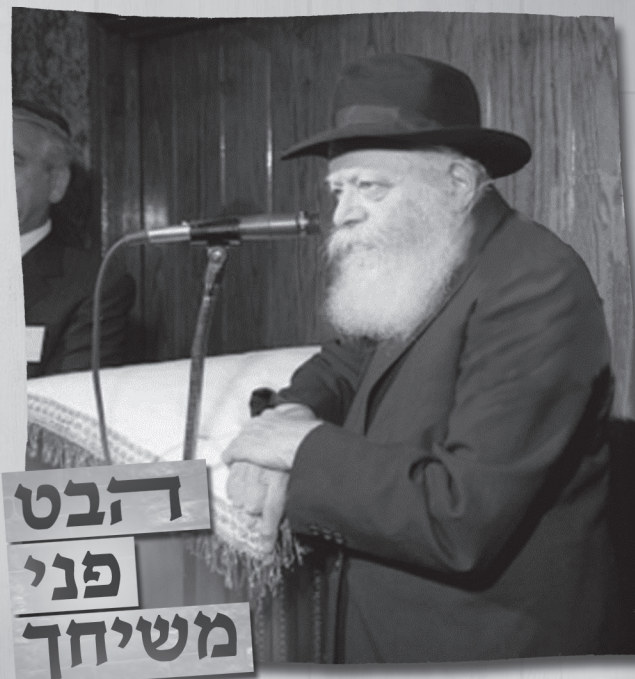
תמונה בפרסום ראשון מכ"ק אדמו"ר מלך המשיח שליט"א

פירוש המלות ד"ל ישועתך קוינו כל היום" הוא לא רק שישנם רגעים ספורים במשך היום שבהם חושב הוא אודות הגאולה העתידה מתוך תקווה וצפי", אלא שמצב זה "לישועתך קוינו" הוא כל היום כל היום ממש! והרי פשוט שלא יתכן שיהודי יעמוד בתנועה ורגש ד"ל ישועתך קוינו כל היום" וברגע זה עצמו ישב רגוע בשלוחה ושאננות מוחלטת ללא כל דאגות!! וכאשר ישנם יהודים שיושבים שאננים מהו הפלא איפוא שכל הארץ יושבת ושוקטת - "הגוים השאננים"?!?