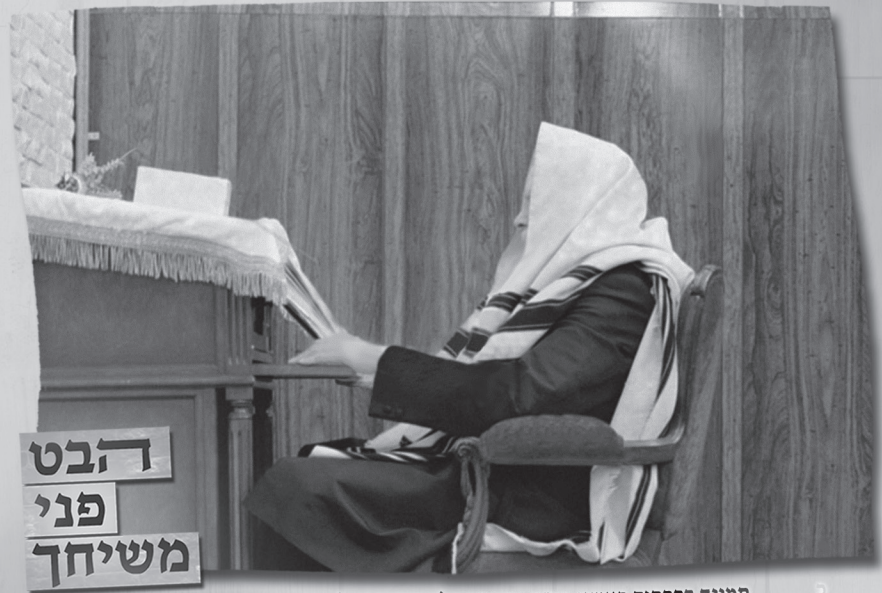
תמונה בפרסום ראשון מכ"ק אדמו"ר מלך המשיח שליט"א