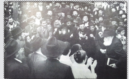
הרבי מלך המשיח שליט"א נכנס לתפילה במהלך הכינוס בתשנ"ב