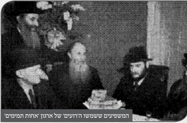
המשפיעים ששמשו ה'רועים' של ארגון 'אחות תמימים'