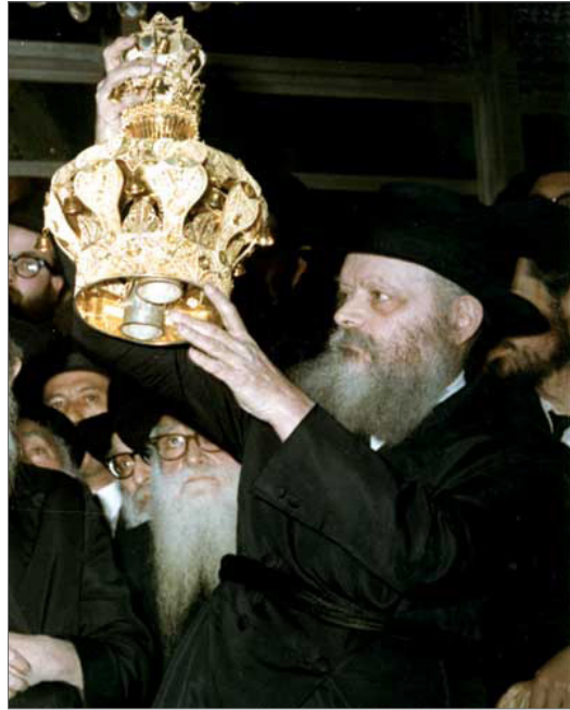
כ"ק אדמו"ר מלך המשיח שליט"א מניח את הכתר על הספר תורה של משיח

לאחר מכן נפתח ספר התורה אל היריעה האחרונה והסופר כותב בו את האותיות האחרונות. לקראת כתיבת האות האחרונה, מגיש הסופר את