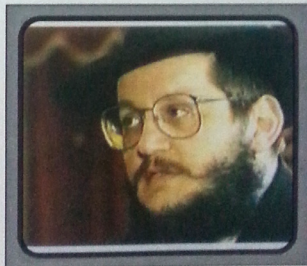
"התממשות בבואתיו של הרבי בקשר לעליה מברית-המועצות, התפרצות הגוש הקומוניסטי, מלחמת המפרץ ועוד, אינה מותירה כל ספק גם באשר לדבריו בנושא הגאולה". (דוד יוסף-יצחק אהרנס ארביט, 4.92)