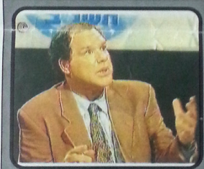
"כשהמשיח יבוא איך אנחנו נדע: יודיעו על זה במבט להדשות; יגיע מטוס מיוחד שקראו לו 'משיח ו'; תהיה עדיית אדמה; איך אנחנו יכלים לנחש שהנה המשיח מעולם איך אני אדע שהאירוע הזה עומד לקרות מחר".