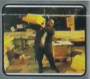
"כאן הוא מרכוס של חסידיו חב"ד בישראל מהמקום הזה הם מפיצים את בשורת הגאולה אשר לזעתם היא קרובה מאוד".