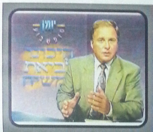
"עשרות אלפי נהגים שחלפו בתקופת הנתיב ברחבי אילון, נדרמו לראות ליד הכניסה ברמת-גן שלטו הכתובה: היכינו לביאת המשיח". (אלעזר עירי, הסוכנייה הישראלית, זמן סוף-סביב 27.8.91)