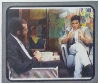
"מסרתו של מסע הפירסום וההסברה בנושא המשיח, הייתה להעלות את כל הנושא הזה של ימות המשיח והציפייה למשיח, על סדר היום הציבורי". (יאיר לפיד ממוחם ברוך, "גובה העיניים" - ערוץ 2 של הסוכנייה הישראלית, 14.10.92)