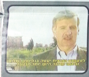
לסעודתו המשיח יגיעה בגלילת השלום (ומאזן קהילה היום יותר ממיליון)