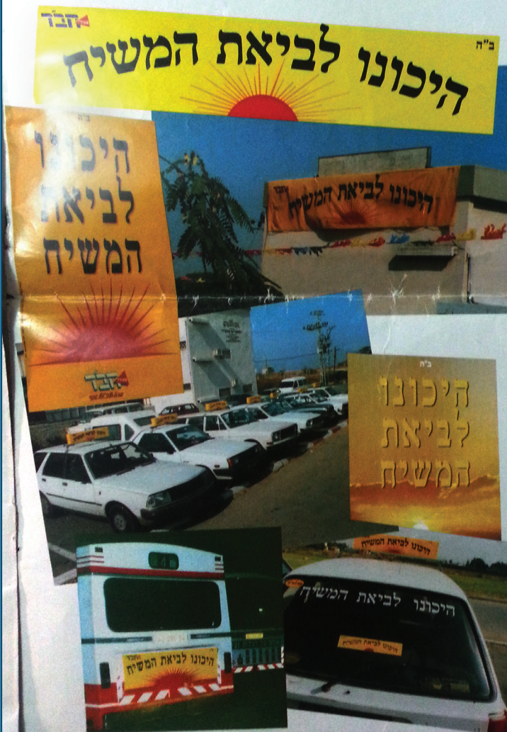
מכה פרסומית אדירה: שלטי חוצות, שלטים מאורים על מכונות, פוסטרים, שלטים על אוטובוסים – משיח בכל מקום