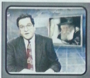
"הרב מנחם מענדל שניאורסון, הוא הרבי מליובאוויטש אמר לחסידיו כי המשיח יבוא בקרוב מאוד. חסידיו בטוחים שהרבי מליובאוויטש הוא הוא המשיח". (עקוב וויי-מאיר, הסוכנייה הישראלית, מבט לחדשות 13.2.92)