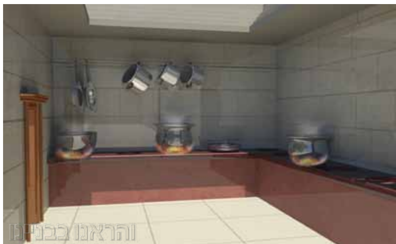
מראה פנים של הלשכה.

כח. שאינם נפסלים ביציאה מעזרת ישראל ויכולים לצאת לעזרת נשים, שלא כעולה, חטאת ואשם שהם קדשי קדשים (רש"י).